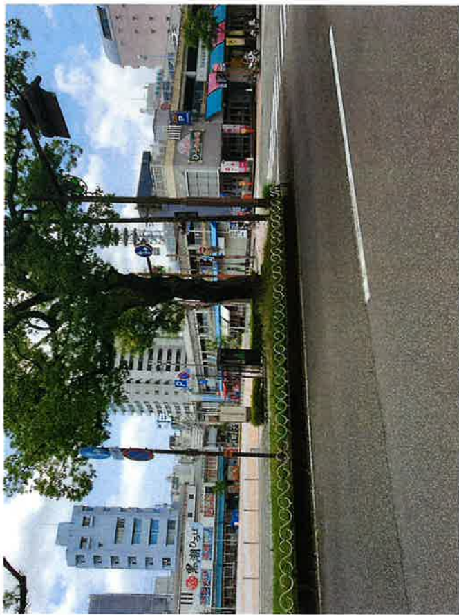
1 おまち多目的広場北面