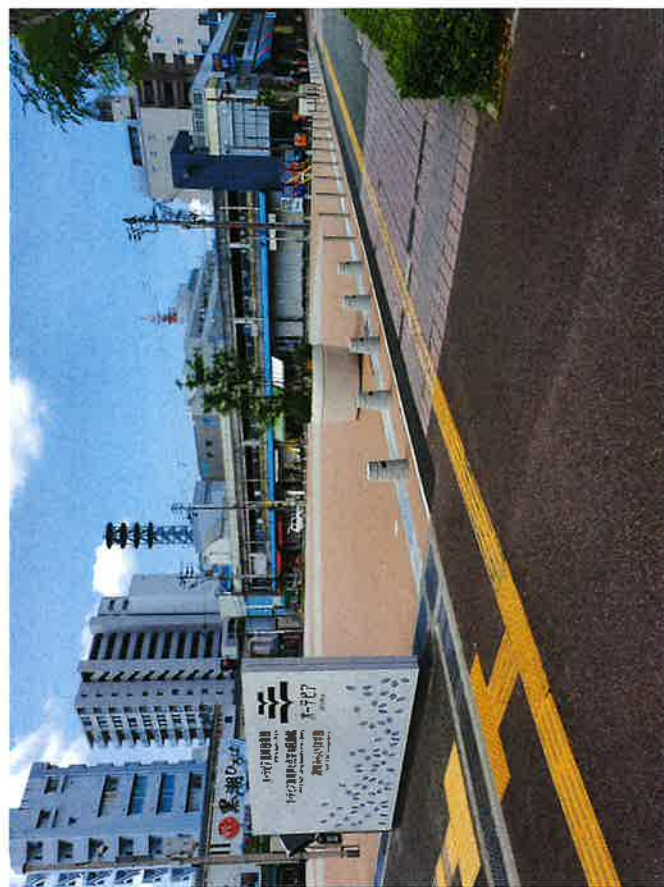
4 おまち多目的広場東面