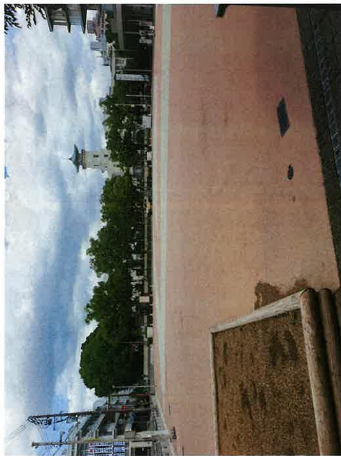
3 おまち多目的広場南面