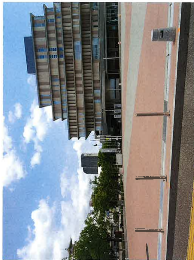
2 おまち多目的広場西面